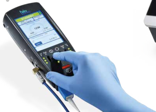
LEONARDO® Mini básico y específico