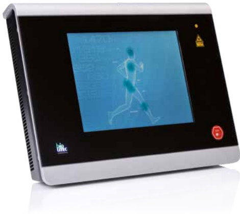
LEONARDO® DUAL 45 universal e ingenioso