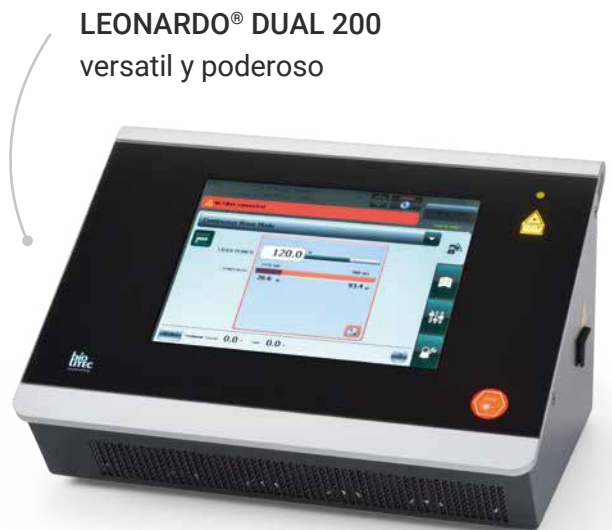
LEONARDO® DUAL 200 versatil y poderoso